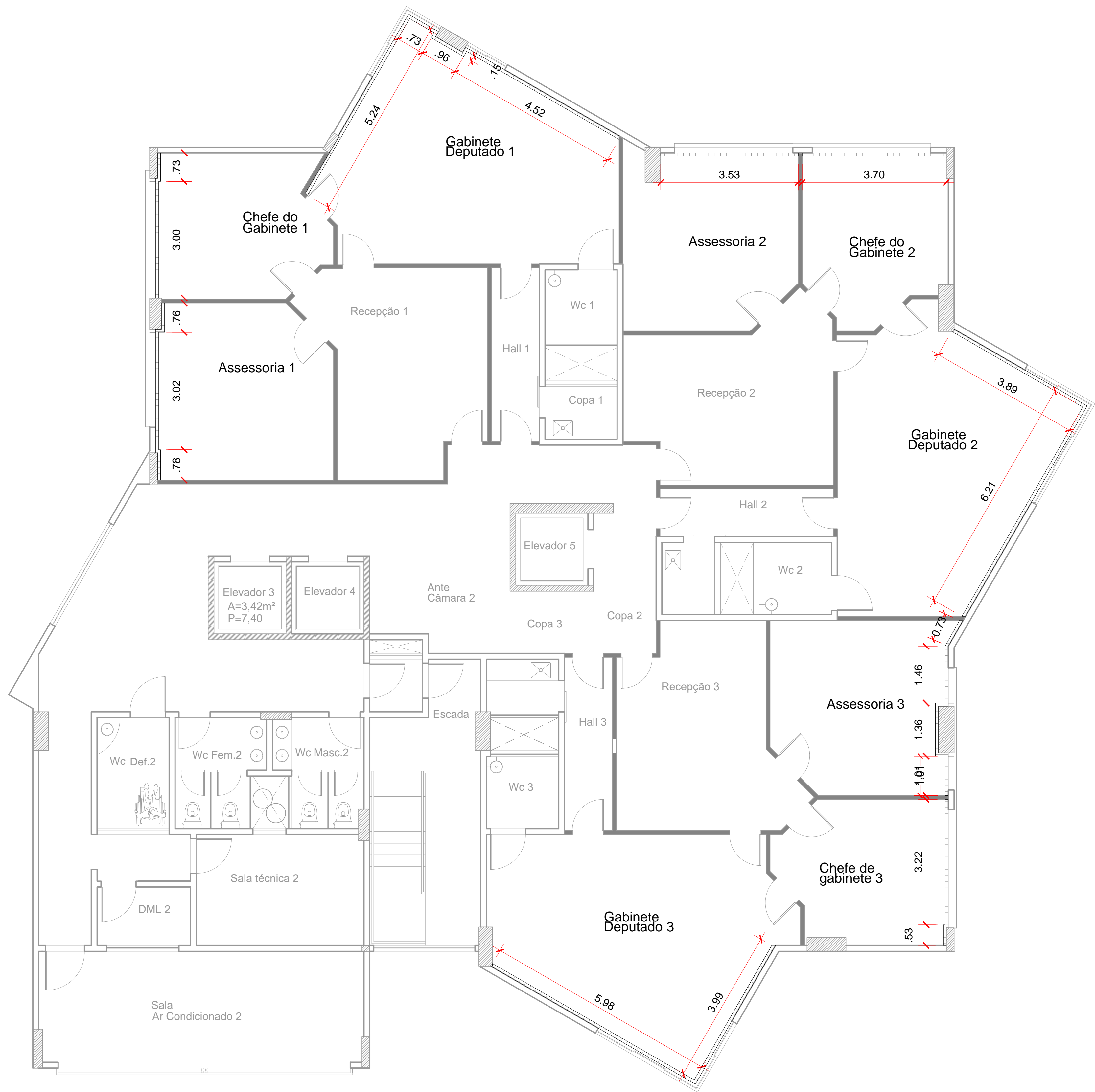
PLANTA BAIXA LAMBRI- 5° AO 12° PAVIMENTO Esc.:Sem Escala