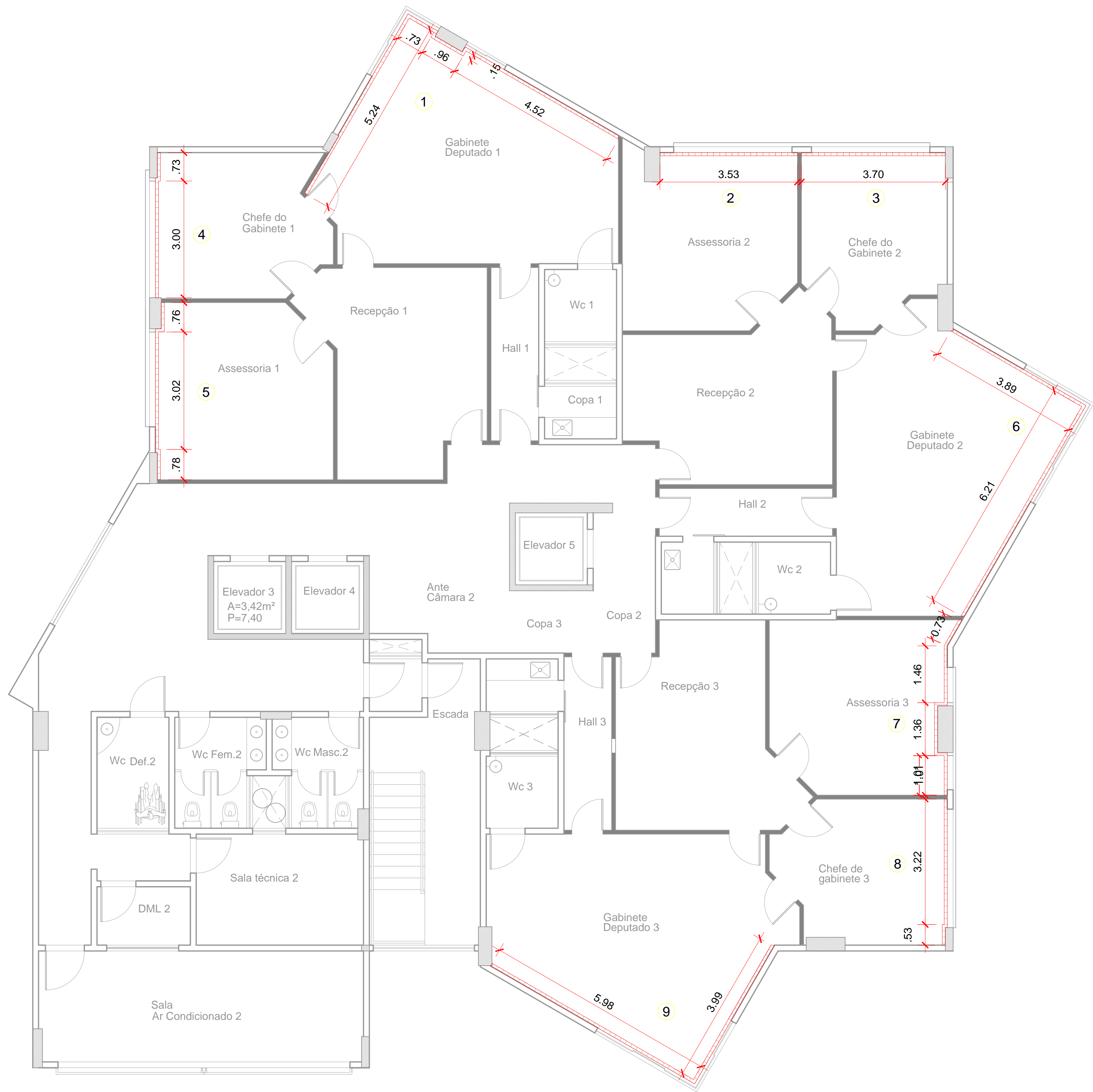
PLANTA BAIXA LAMBRI- 5° AO 12° PAVIMENTO Esc.:Sem Escala