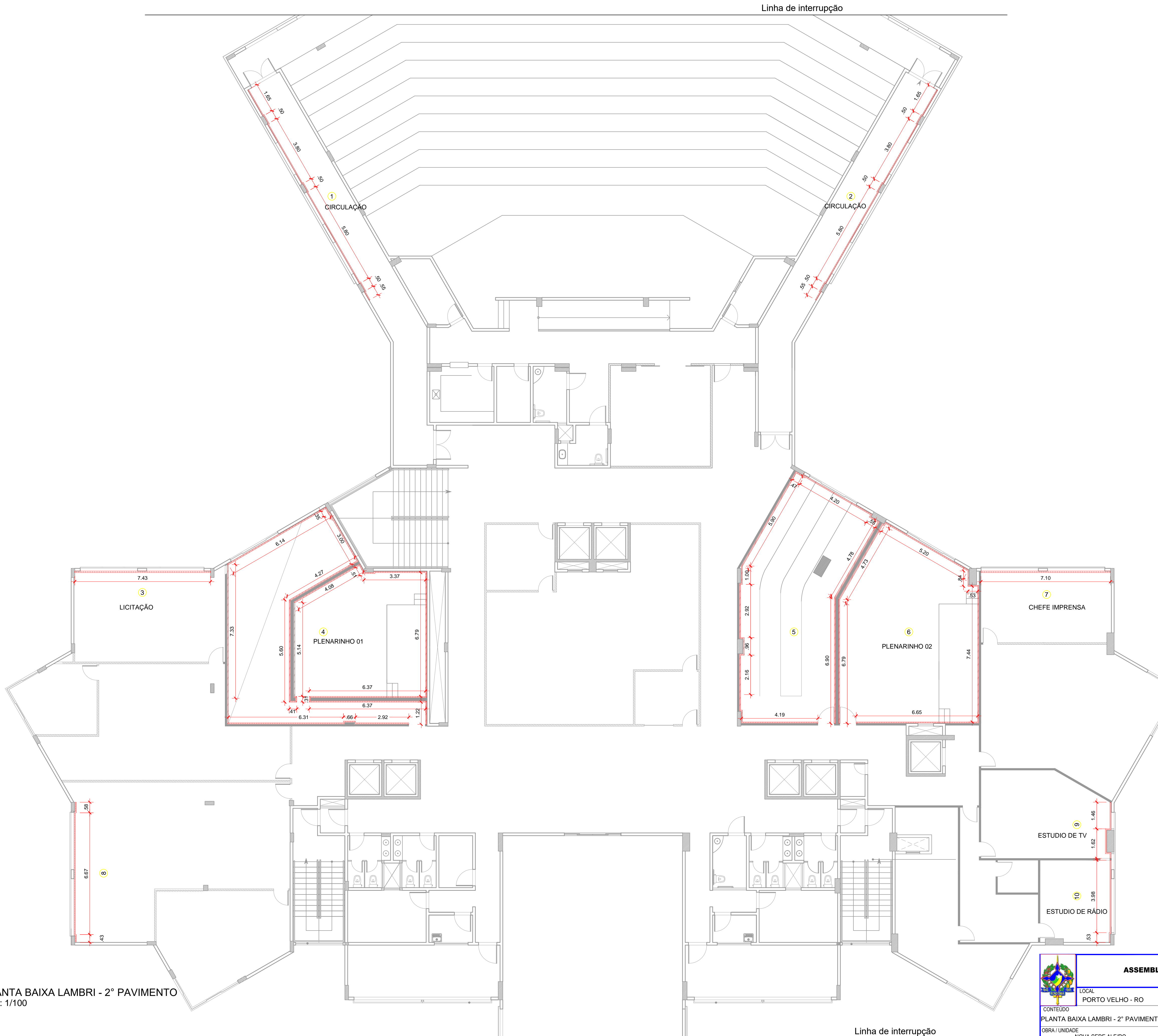
PLANTA BAIXA LAMBRI - 2º PAVIMENTO Esc.: 1/100