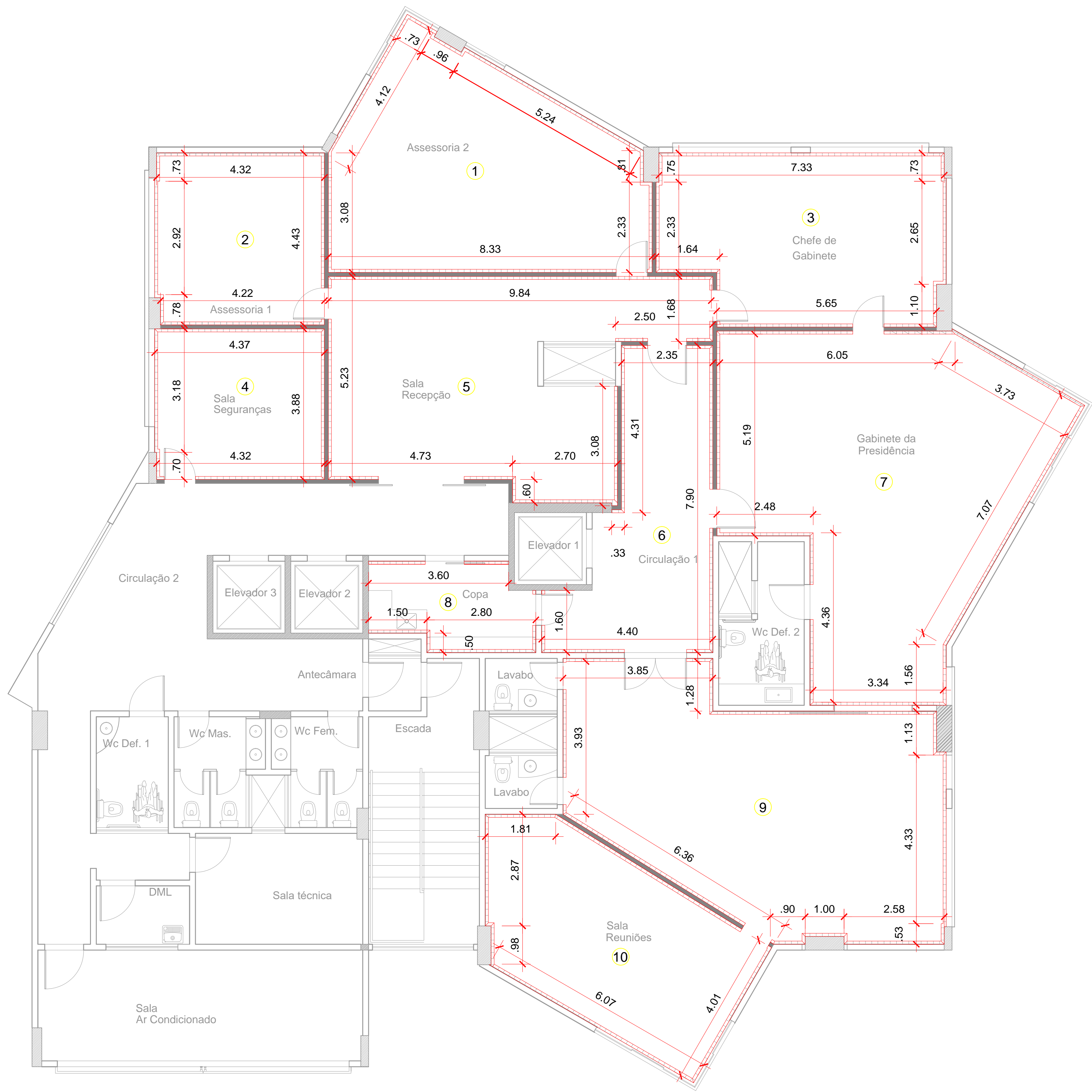
PLANTA BAIXA LAMBRI- 13° PAVIMENTO Esc.:Sem Escala