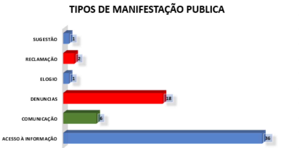
Gráfico 2: Tipos de Manifestações

pedido de acesso a informação, comunicação e sugestão da sociedade, totalizando 18 denúncias, 36 pedidos de acesso a informação, 6 comunicação, 1 elogio, 2 reclamações e 1 sugestão de acordo com o gráfico 2: