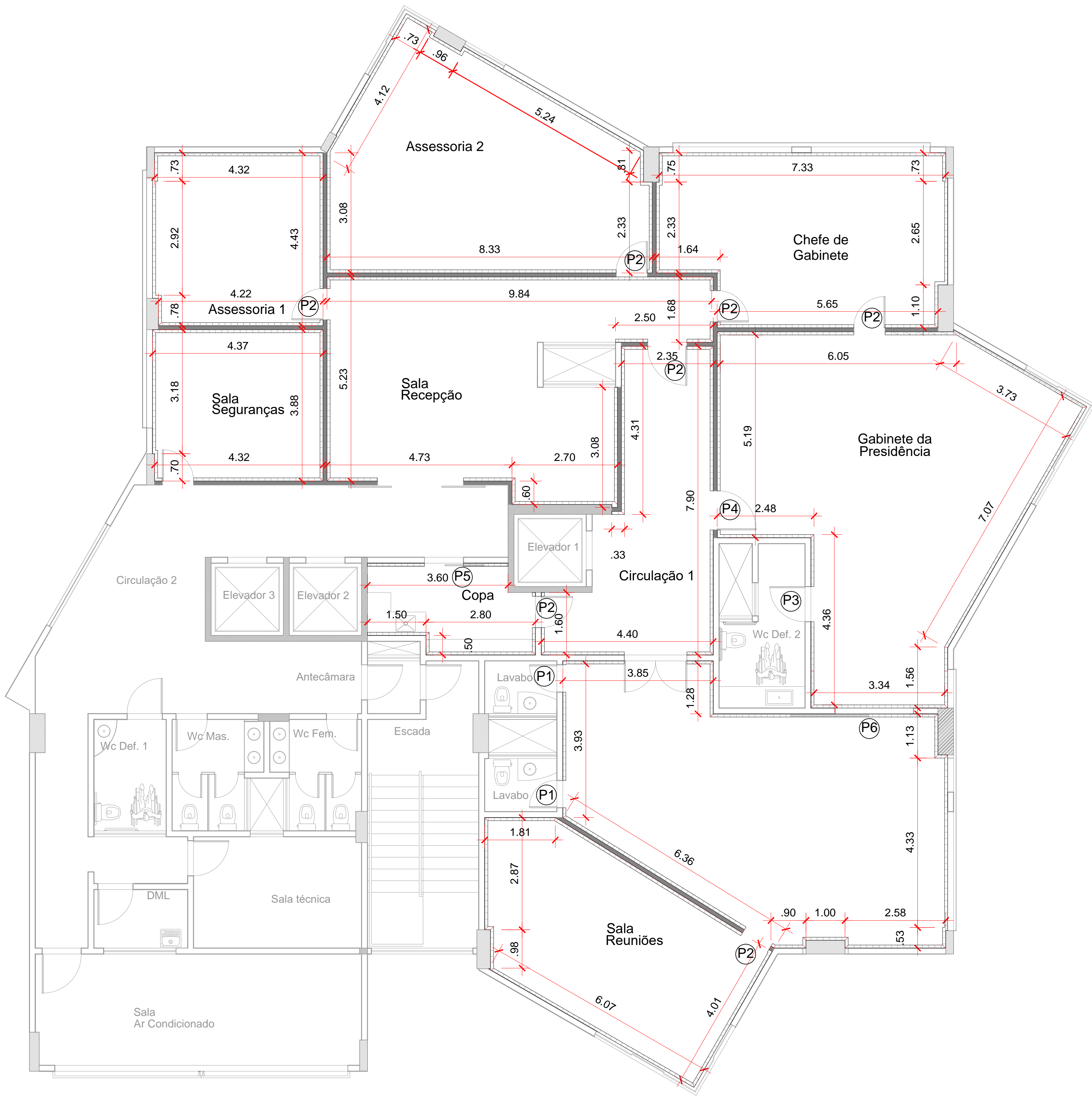
PLANTA BAIXA LAMBRI- 13º PAVIMENTO Esc.:Sem Escala