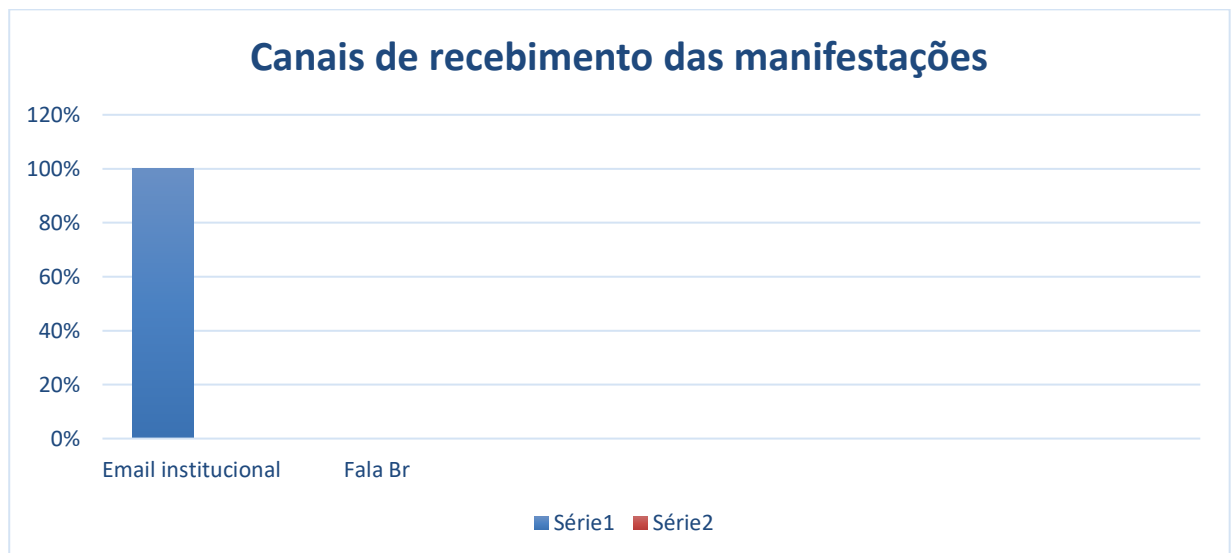
Gráfico 1 – Canais de Recebimento das Manifestações

No período compreendido entre 01 de março a 31 Julho de 2022, a Ouvidoria Administrativa recebeu 35 (trinta e cinco) manifestações da sociedade, reportando denúncias, elogios, solicitação de informação, pedido de acesso a informação e comunicação, sendo que 100% por meio de e-mail institucional e 0% por meio do canal FALA BR, conforme gráfico 1 a seguir: